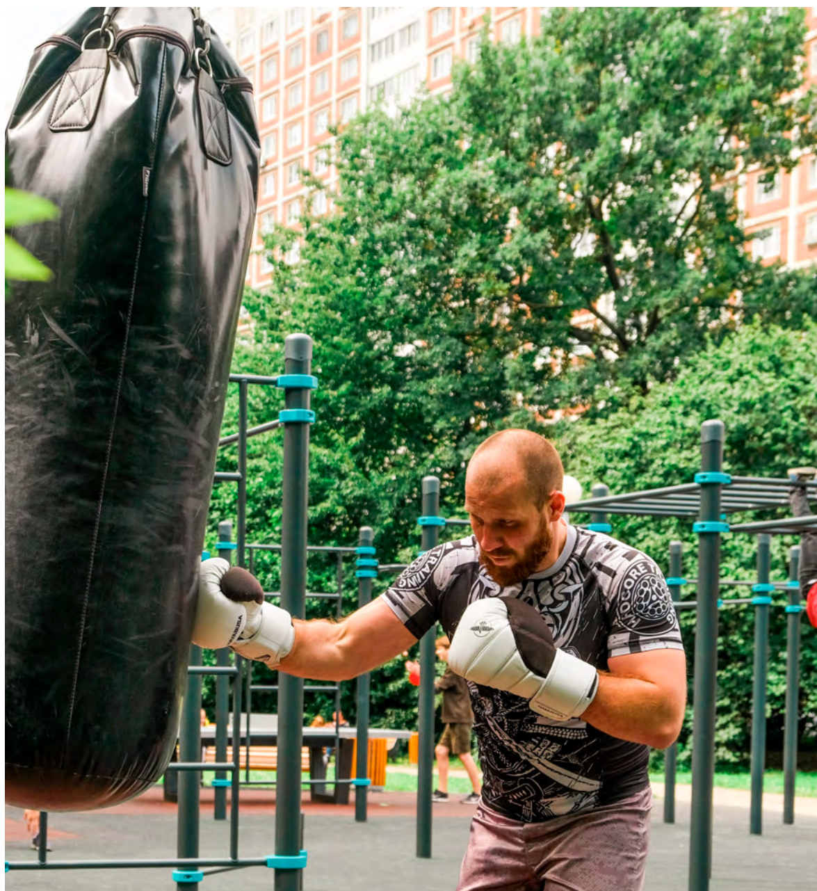
Боксерские стойки с антивандальными мешками