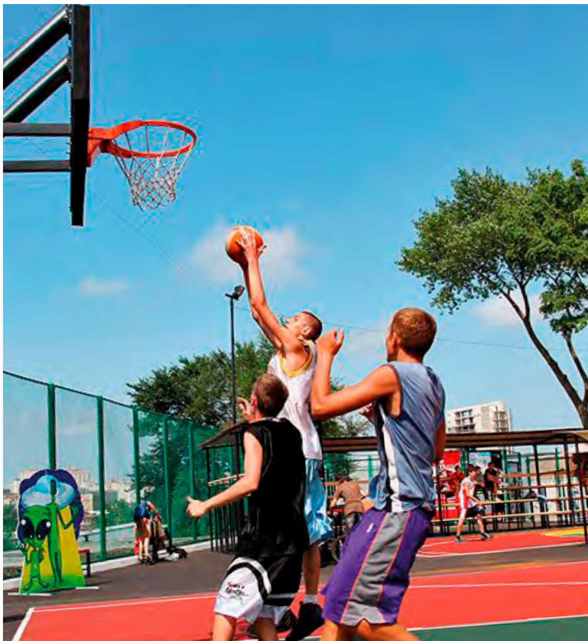
Уличный баскетбол с игрой в одно кольцо